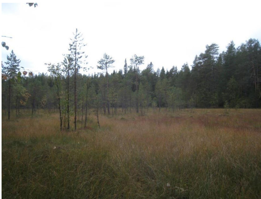
Kuva 6-3. Metsälain 10 § tarkoittama vähäpuustoinen suo syyskuussa kuvattuna.