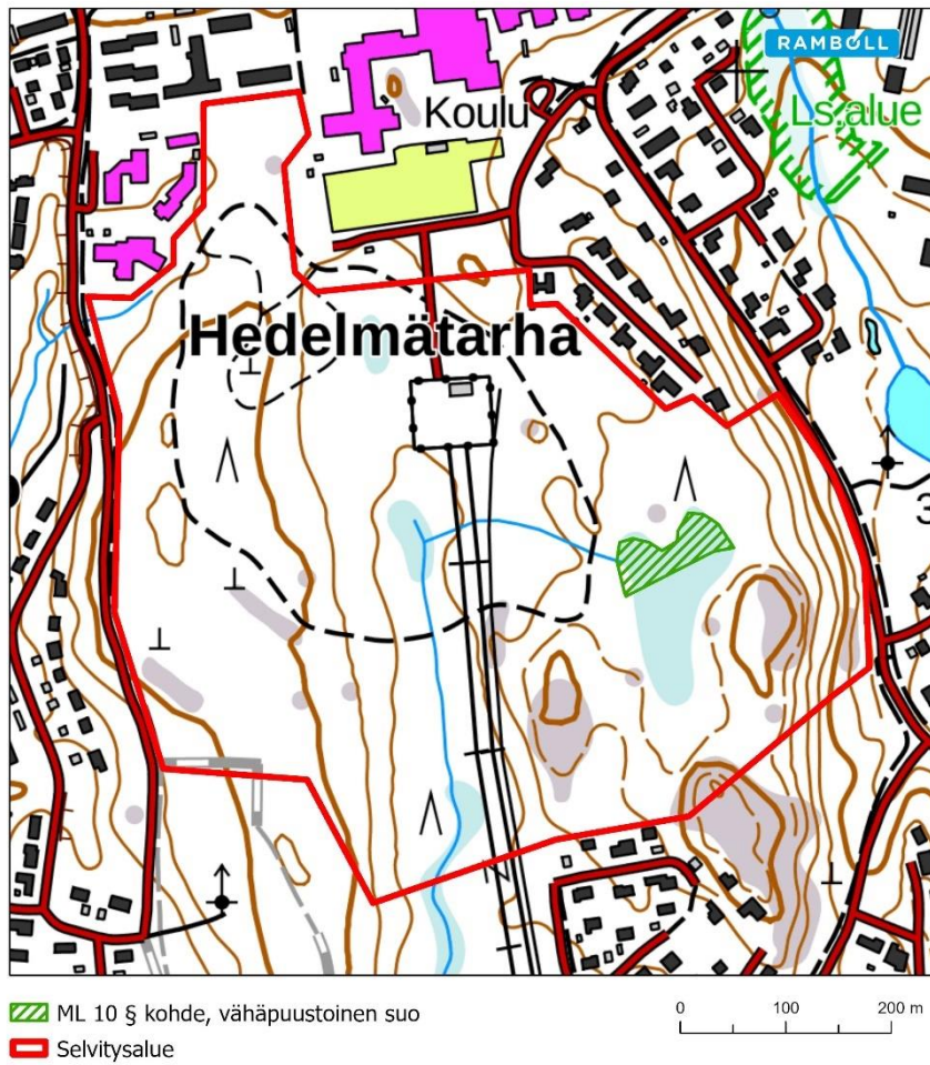
Kuva 6-2. Metsälain 10 § tarkoittaman vähäpuustoisien suon sijainti.