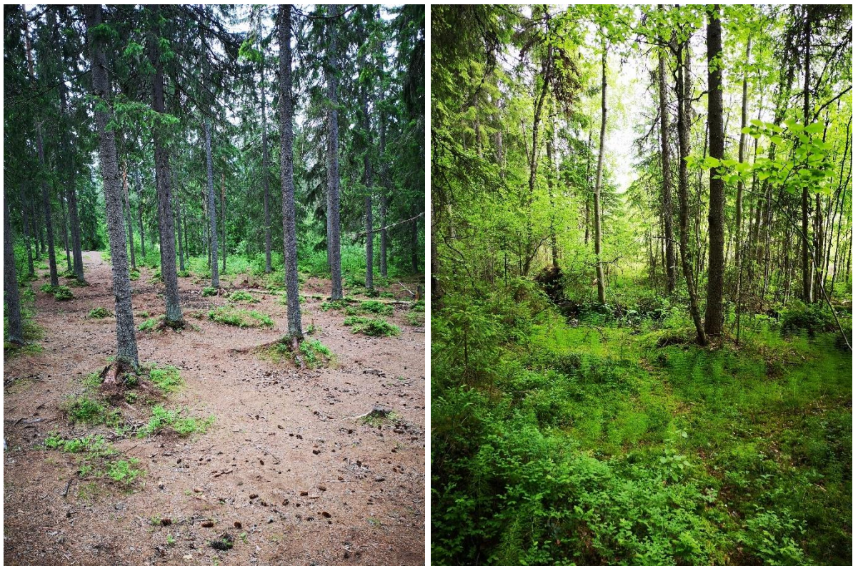
Kuva 6-1. Kulunutta maaperää alueen pohjoisosassa frisbeegolfradan varressa (vasen kuva) ja korven piirteitä omaavaa ojauman vartta alueen keskiosissa (oikea kuva).

Itäisimmällä laidalla selvitysalueesta varttunut tuoreen kankaan kuusikko vaihettuu lehtomaiseksi kankaaksi, jossa on osin näkyvissä kulttuurivaikutteisuus. Rajat ympäröiviin luontotyyppeihin eivät ole selkeitä, vaan vaihtelevat avoimuuden ja varjostuksen mukaan. Valtapuuna on kuusi ja pensaskerroksessa esiintyy pihlajan, koivun ja paikoin kuivemmilla laikuilla kasvavan katajan ohella myös tammea ja vaahteraa. Kuntotiehen rajautuvassa rinteessä kukkii keväisin runsaasti vuokkoja ja lisäksi lajistossa on käenkaalia, metsämitikkaa, kieloa, metsäkurjenpolvea ja metsäimarretta, kuivemmilla laikuilla myös metsälauhaa.